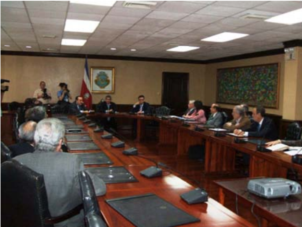
Reunión el 16 de enero de 2008 del Consejo Directivo de UCCAEP con el Sr. Presidente Oscar Arias, el Ministro de la Presidencia, Rodrigo Arias y el Ministro de Comercio Exterior, Marco Vinicio Ruiz.

Asimismo, a través de sus distintos órganos la UCCAEP se mantuvo una intensa actividad con los principales actores que componen el marco político nacional, incluyendo encuentros con el señor Presidente de la República, y con los jefes de las carteras e instituciones públicas más vinculadas al sector productivo empresarial, tales como COMEX, MEIC, MTSS, MINAE, ICE, CCSS, INS, INA, entre otras.