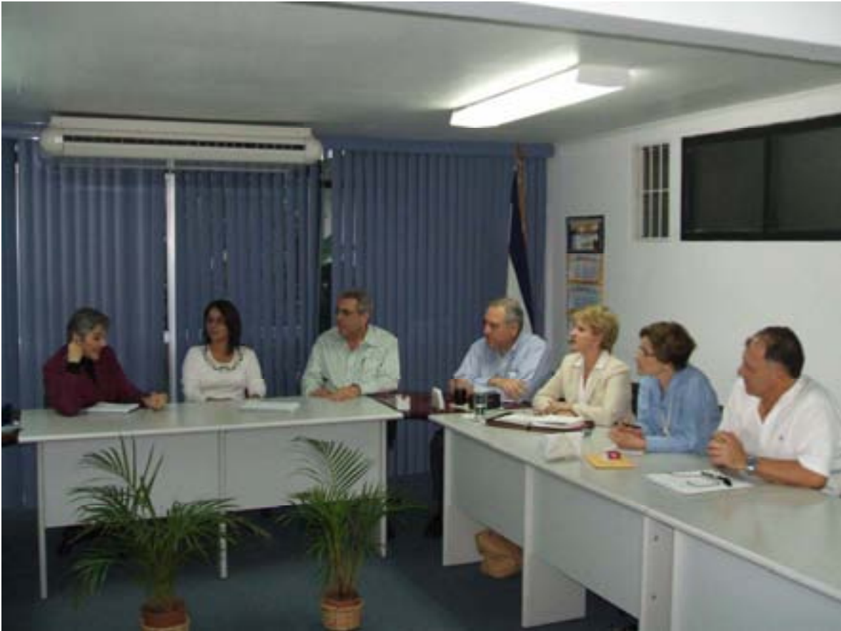
Reunión Comisión TLC (13 de febrero de 2008)

Sin duda, el Tratado de Libre Comercio entre Centroamérica Estados Unidos y República Dominicana fue el gran tema que ocupó la agenda de la Unión de Cámaras en el ámbito de comunicación durante el 2006-2007.