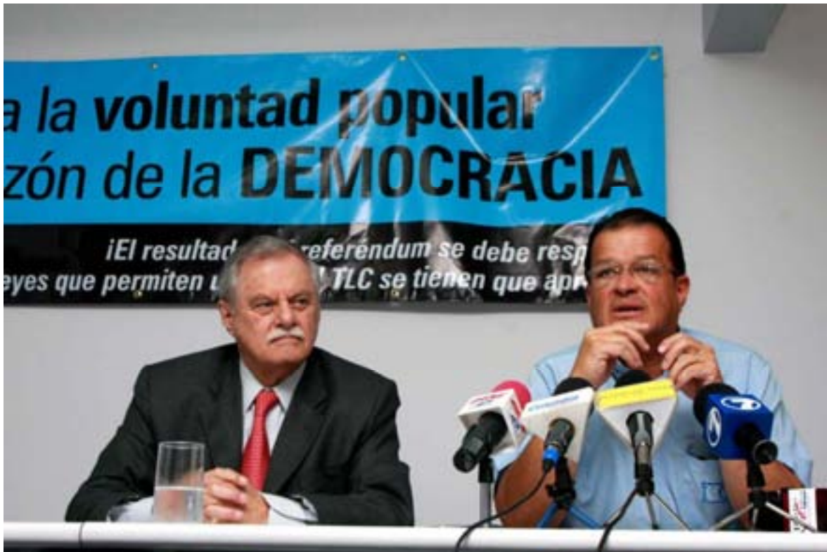
Conferencia de Prensa 12 de febrero de 2008 donde se expuso el perjuicio de no tener vigente el TLC para los sectores de textiles y atún

Junto a las noticias varios representantes de UCCAEP escribieron un total de ocho artículos de opinión que aparecieron en medios de comunicación, entre ellos La República, La Nación y El Financiero.