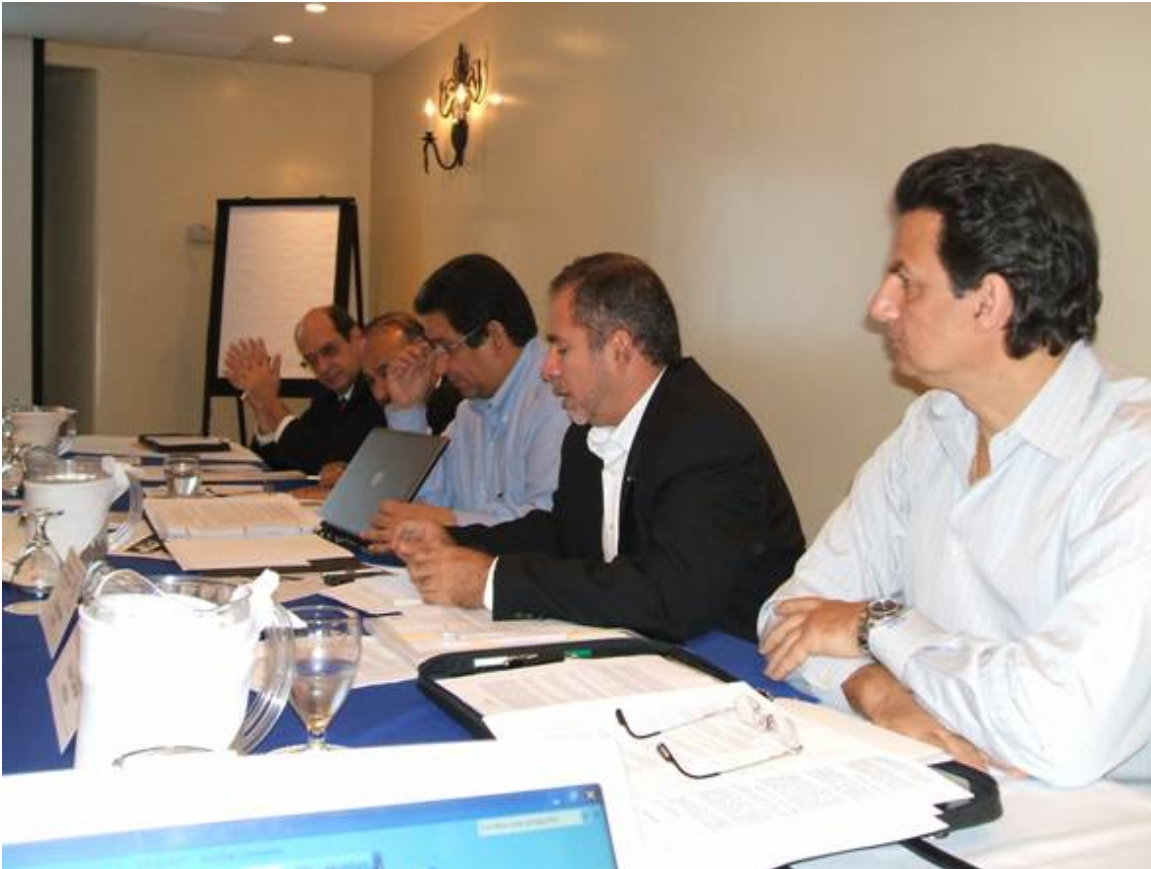
Reunión en Costa Rica de los representantes de FEDEPRICAP en julio de 2007. En la imagen aparecen los representantes de las cúpulas de Honduras y Panamá.

Vale recordar la participación del Presidente de UCCAEP en la celebración del 35 aniversario de fundación del Consejo Superior de la Empresa Privada de Nicaragua. A ello se suma la presentación en el Consejo Hondureño de la Empresa Privada sobre Educación superior: desafíos desde la perspectiva del sector productivo, en el marco de la celebración del aniversario de esa organización.