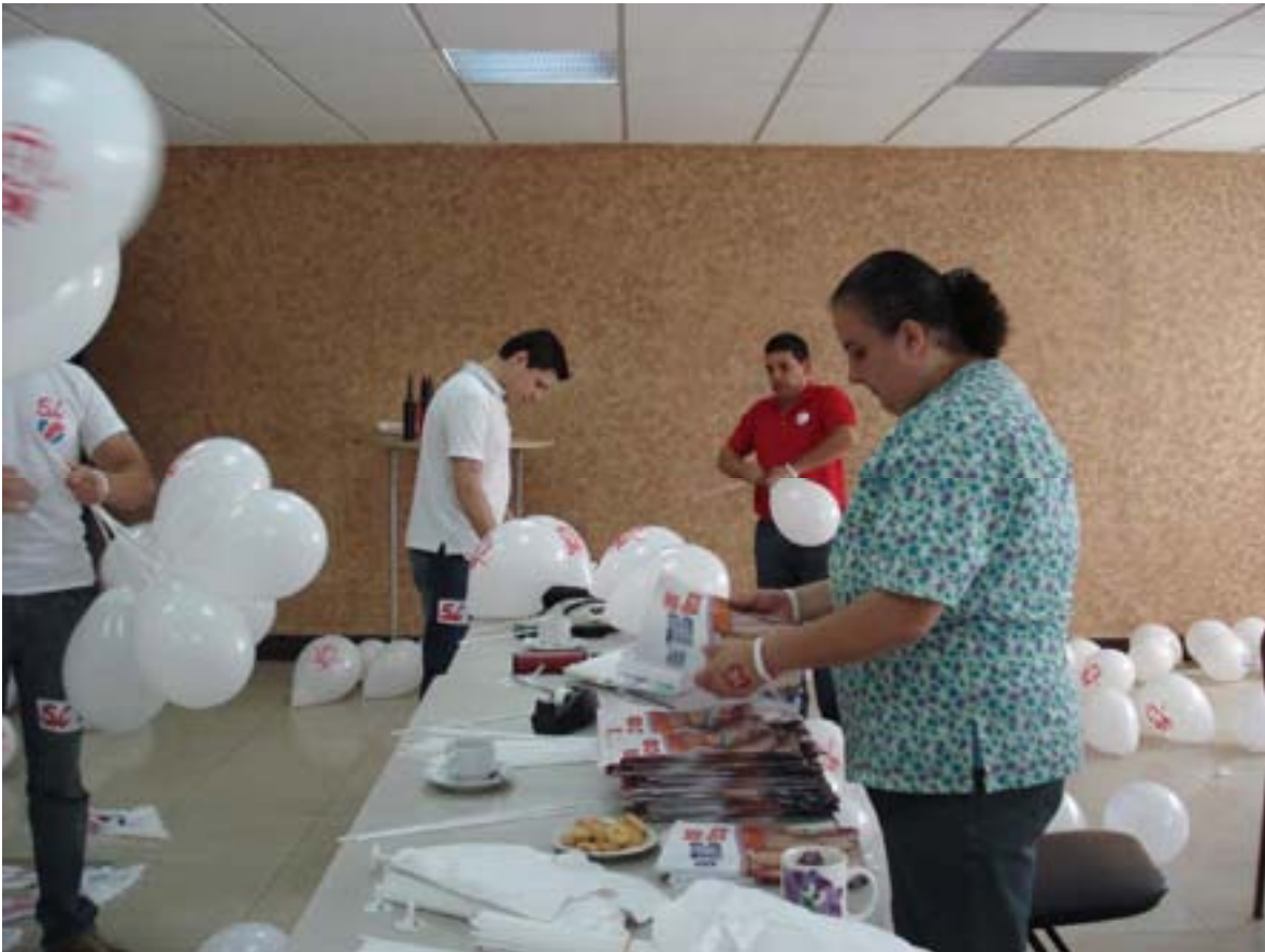
Preparación del material para el volanteo en las instalaciones de la Cámara de Comercio (Oct. 2007)

Así mismo, el día del referendo el personal de UCCAEP trabajó en diferentes áreas entre ellas transportes, visitas a centros de votación, observadores en las mesas de electorales y fiscales de mesa.