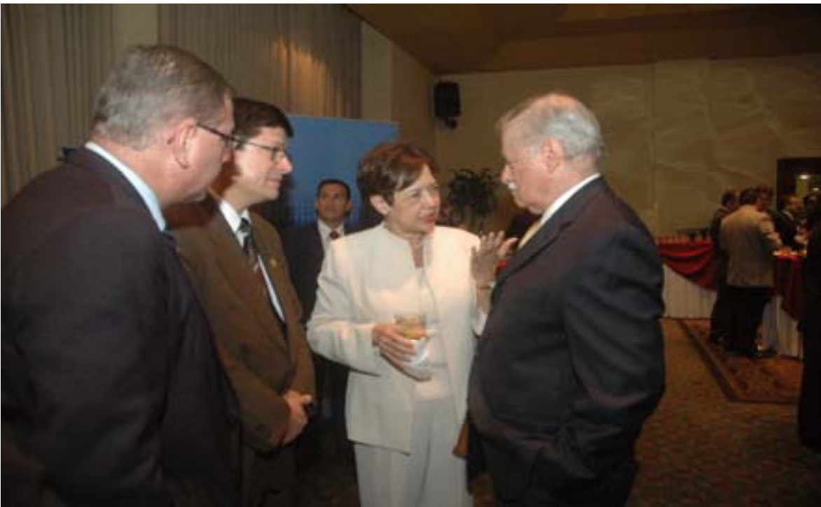
En la actividad que contó con la presencia de más de 400 personas hubo una delegación de diputados del Partido Acción Ciudadana.

La propuesta entregada señala que “la tarea de volver a colocar a Costa Rica en la senda de la prosperidad es responsabilidad compartida entre todos los que vivimos en este país. Nuestro objetivo prioritario debe ser la búsqueda del interés nacional, dejando de lado apasionamientos políticos y gremialistas, pensando en la nación que queremos heredar a las futuras generaciones. Por eso es que hoy UCCAEP entrega esta hoja de ruta con los diez temas prioritarios que consideramos esenciales para el desarrollo del país; en ella se supone que los pilares democráticos de nuestro país serán respetados y que la implementación del acuerdo comercial con Estados Unidos será una realidad a muy corto plazo”.