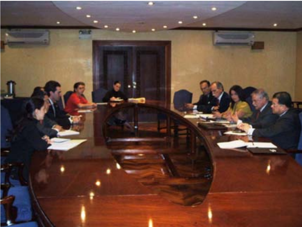
Reunión en diciembre de 2007 del Comité Ejecutivo de UCCAEP con Bruno Stagno, ministro de Relaciones Exteriores donde el sector externó su posición con respecto a temas laborales y de cooperación en el Acuerdo de Asociación con la Unión Europea.

Dada la naturaleza de la agenda nacional, igualmente se mantuvo durante el año 2007 una estrecha relación con el Poder Legislativo, especialmente en la tramitación del TLC, antes de que se convocara a referendo, y los proyectos de la agenda de implementación.