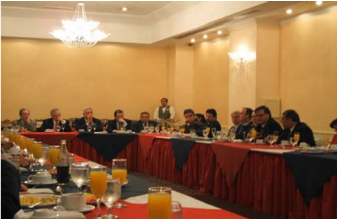
El tema de fondo del desayuno con asociados y patrocinadores fue el ajuste en las bandas cambiarias y estuvo a cargo de Francisco de Paula Gutiérrez, presidente del Banco CentralWOW

La actividad contó con la presencia de la mayoría de los afiliados y de un buen grupo de patrocinadores.