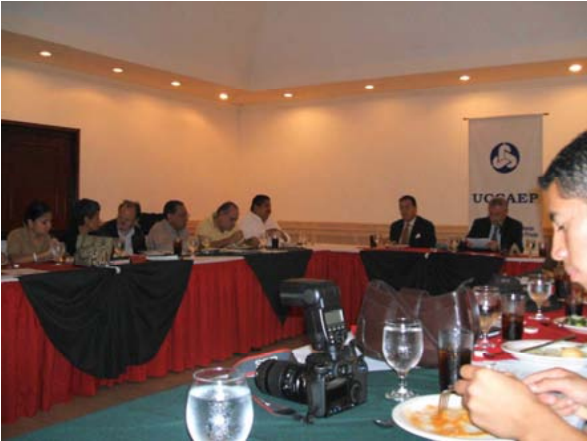
Almuerzo navideño con la prensa Diciembre de 2007.

de comunicación y deseara dar a conocer la información que se genera se hubiese tenido que desembolsar una suma superior a los ¢190 millones por los espacios y las secciones en las cuales aparecieron las notas generadas por UCCAEP. Esto solo en prensa escrita, sin tomar en cuenta la gran presencia en televisión y radio.